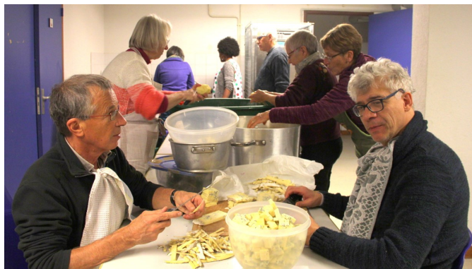
Une équipe de bénévoles qui met la main à la pâte dans la bonne humeur !

Fermeture de La Mondée du 22 décembre au 6 janvier