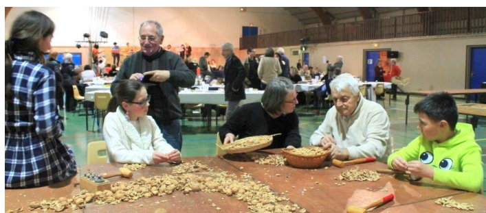
Une Mondée traditionnelle pour papoter !