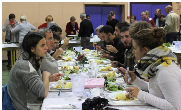
120 repas partagés dans la convivialité !