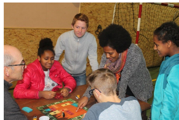
Des échanges inter générationnels !