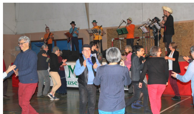
Quelques pas de danses effrénées !