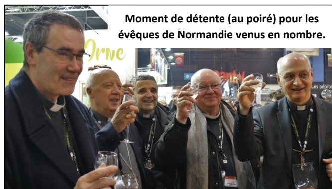
Moment de détente (au poiré) pour les évêques de Normandie venus en nombre.

Quelques jours avant cette visite un communiqué de presse « VOTRE MISSION EST UNIQUE ET NECESSAIRE » a été rédigé par le conseil permanent de la CEF. Le CMR et le MRJC ont aussi apporté leur soutien aux agriculteurs. clac